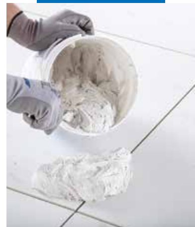
Нанесення кремподібного однорідного розчину

Рекомендовано використовувати абразивну губку Scotch-Brite® замість звичайної целюлозної губки для очищення