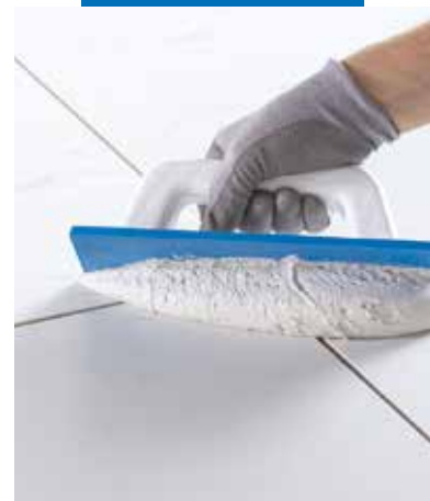
Заповнення Kerapoxu Easy Design шпателем MAPEI