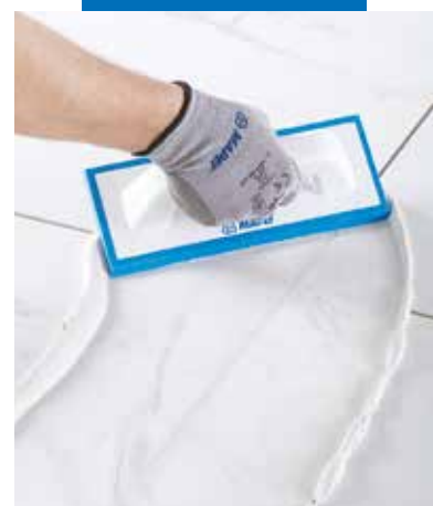
Легке нанесення епоксидного заповнювача швів